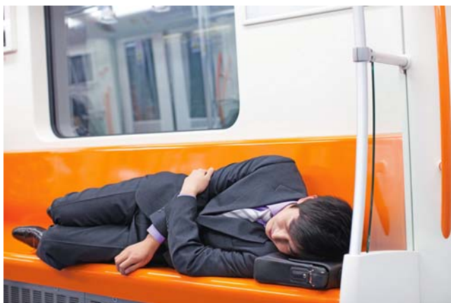
U-Bahn fahren in Japan. Hier ist es normal, kurz einzunicken. Niemand stört sich daran, solange kein anderer Fahrgast belästigt wird.

Das Phänomen ist jedoch ganz normal, denn alle Menschen haben mittags ein Leistungs- und Energietief, physisch wie auch psychisch. Es ist zwischen 13 und 14 Uhr besonders stark ausgeprägt. Unsere Körpertemperatur sinkt, und die innere Uhr sagt uns, dass wir ausruhen müssen. »Wir dürfen nicht vergessen, dass die innere Uhr einen wichtigen steuernden Einfluss auf die Organe und Zellen hat«, sagt Powernapping-Autor Andreas Atteneder. Sie sorgt für unsere Regenerationsfähigkeit. Körper und Seele müssen sich von selbst reparieren und erholen. Je öfter wir die innere Uhr ignorieren, desto häufiger können Krankheiten entstehen.